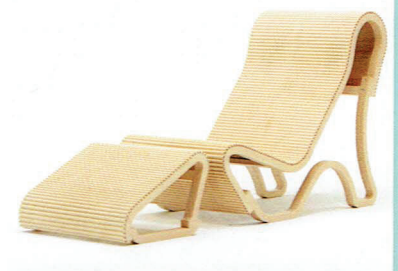
発明大賞 日刊工業新聞社賞 (株) 今井産業