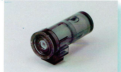
発明大賞 東京都知事賞 (株) TOK