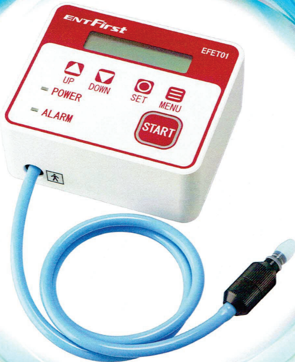
発明大賞 本賞 第一医科(株)